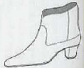
ショート・ブーツ Short boots