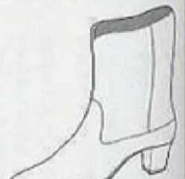
ハーフ・ブーツ Half boots