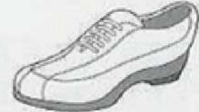
ウォーキング・シューズ Walking shoes