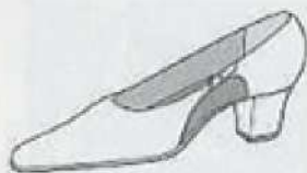
サイド・オープン(オープン・シャンク) Side open