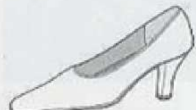
ハイヒール・パンプス High heel pumps