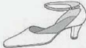
アングラー・ストラップ Ankle strap