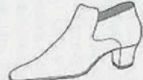
アングラー・ブーツ Ankle boots