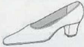
ミッドヒール・パンプス Middle heel pumps