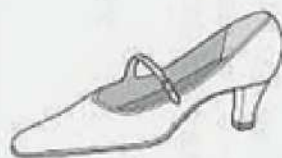
インステップ・ストラップ Instep strap