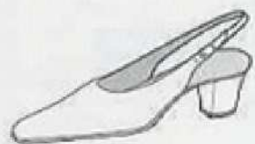
スリッパ・バック(オープン・バック) Sling back