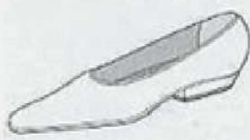
ローヒール・パンプス Low heel pumps